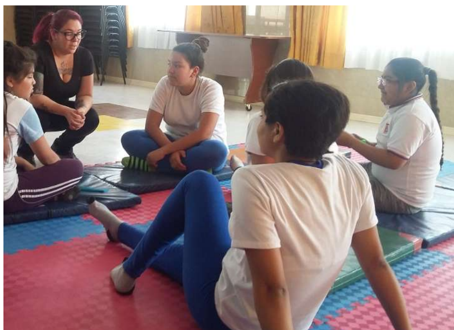
Algunes joves de l'escola marista d'Alto Hospicio en una sessió formativa (SED, 2016).

davant amb la maternitat. Vaig conèixer noies molt joves amb fills. Sovint, la figura paterna no era present, per diferents raons. L'estiu de 2016 vaig compartir l'embaràs d'una noia de catorze anys i em va sorprendre la naturalitat amb què ho vivien ella i el seu entorn.