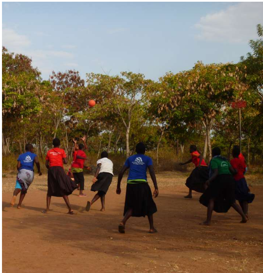
Noies de l'escola secundària marista a Masonga, Tanzània (SED, 2015).

Thinspo m. Conjunt d'elements culturals difosos per la xarxa en què joves presenten un físic marcat per la carència de greixos. Majoritàriament, són imatges amb frases motivacionals que animen altres joves a mantenir conductes de salut extremes per tal d'aconseguir un ideal de bellesa concret. Està relacionat amb transtorns alimentaris i té incidència en les dones.