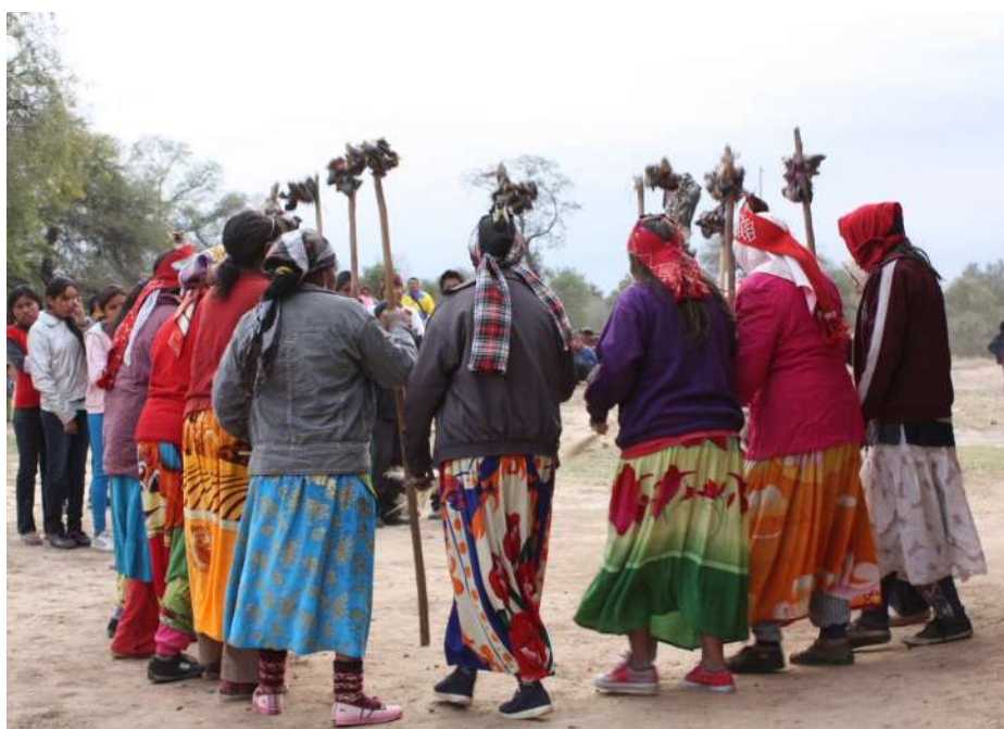
Les dones Nivaklé, al desert del Chaco paraguaià (SED, 2014).

SED Catalunya volem dir la nostra en aquest camí cap a l'emancipació de les dones arreu del món i, per fer-ho, multipliquem les forces amb l'ajuda de les voluntàries que s'han sumat a l'elaboració d'aquest document.