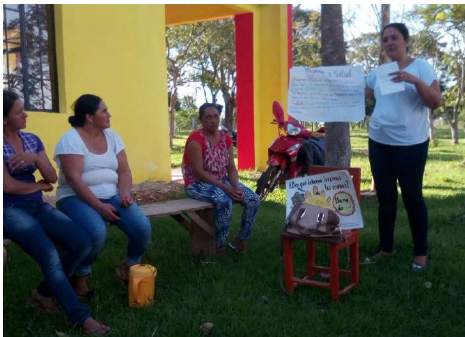
Projecte Agua potable para Montanaro , al Paraguai (Comissió Veïnal Montanaro, 2017).

Aquesta societat androcèntrica, infravalora la dona i els infants. Vaig veure que l'home tenia dret a sortir, beure i fumar, però aquestes coses estaven mal vistes en una dona. La dona en molts casos és vista només com a objecte sexual. Vaig percebre que havia noies treballant en botigues, els caps de les quals les forçaven a tenir relacions sexuals amb ells.