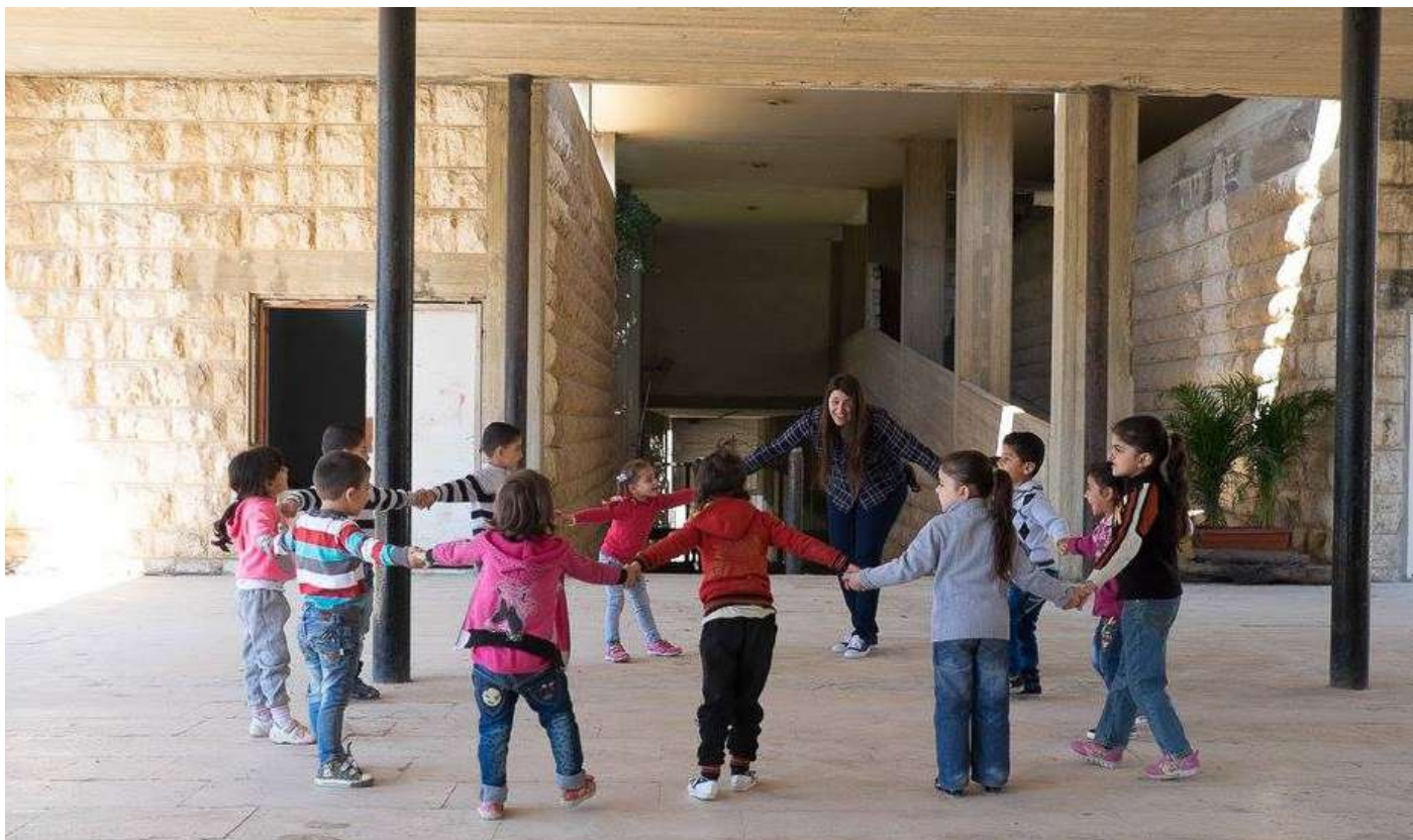
Infants sirians i una educadora libanesa al centre socioeducatiu Fratelli, a Saida, Líban (Fratelli project, 2016).

A la convenció de Ginebra de 1951, es va acordar la definició de persona refugiada, la qual no incloïa el gènere com a motiu explícit pel qual una persona pot tenir temor de ser perseguit. No obstant això, l'ACNUR, en documents posteriors, sí que ho va incloure.